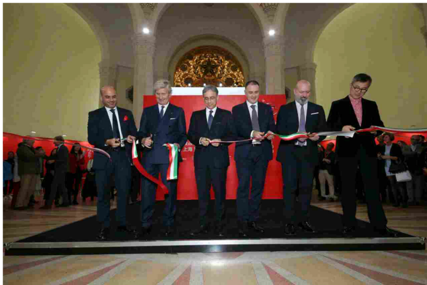
Il taglio del nastro che inaugura ufficialmente la seconda edizione del Salone del Mobile Milano.Shanghai