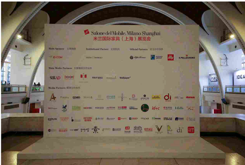
tutti i brand presenti alla seconda edizione del Salone del mobile di Milano.Milano Shanghai

Il raddoppio degli espositori, che hanno occupato tutta l'area del prestigioso SEC, Shanghai Exhibition Center , è la riprova dell'interesse da parte degli imprenditori del settore, compresi quelli che producono anche o solo arredamento per cucina, che in questa edizione sono 8: Aran Cucine, Arclinea, Binova, Dada, Ernestomeda, Poliform, Riva1920, Scavolini .