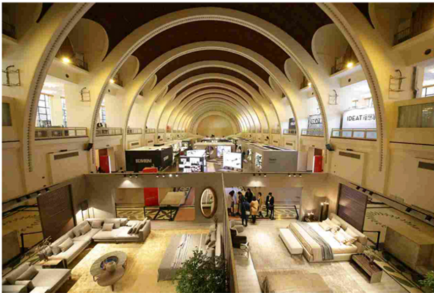
Vista dall'alto dello spazio espositivo del prestigioso SEC dove si svolge la tre giorni del Salone del Mobile.Shanghai

Il raddoppio degli espositori, che hanno occupato tutta l'area del prestigioso SEC, Shanghai Exhibition Center , è la riprova dell'interesse da parte degli imprenditori del settore, compresi quelli che producono anche o solo arredamento per cucina, che in questa edizione sono 8: Aran Cucine, Arclinea, Binova, Dada, Ernestomeda, Poliform, Riva1920, Scavolini .